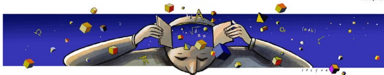
↑ La première version de l'illustration