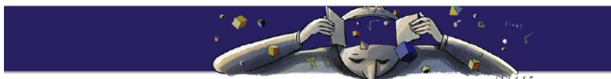
↑ L'illustration retouchée en 2014

Cliquez pour voir l'image en plein écran / Click to see the picture in full screen